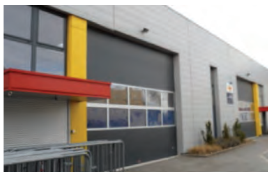
Locaux loués pour les ateliers départementaux, rue du prunier à COLMAR