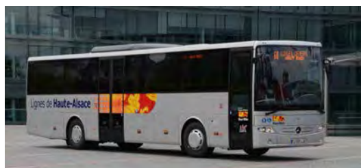
Depuis la rentrée 2012, le réseau de bus interurbains est aux couleurs de la Haute-Alsace.