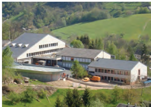
Restructuration et extension du collège G. Martelot à ORBEY

Des études préalables ont principalement concerné les futurs travaux de la Médiathèque d'ALTKIRCH, des centres routiers de BARTENHEIM et VIEUX-FERRETTE, la requalification du site Seijo à KIENTZHEIM ainsi que différents Centres médico-sociaux. Par ailleurs, la Direction de l'Architecture a poursuivi son activité d'expertise technique dans le domaine du bâtiment pour le SDIS et les services du Conseil Général (social, culturel).