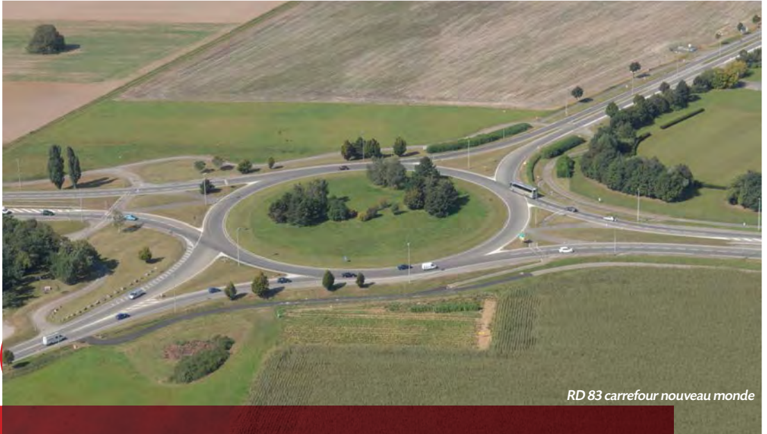
RD 83 carrefour nouveau monde