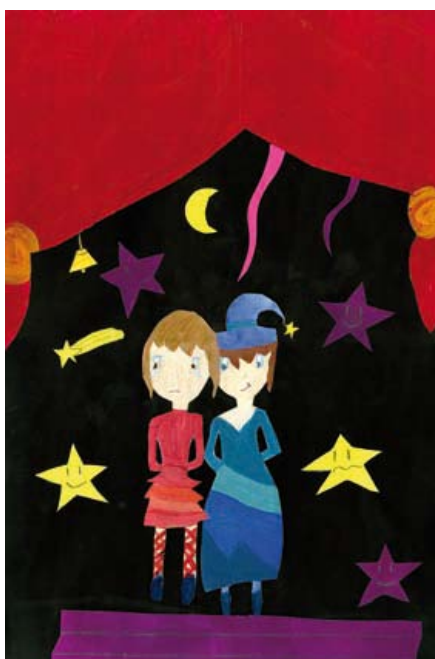
Dessin réalisé par Alisson Pereira et Cheima Jeridi qui a servi de visuel pour l'affiche de Rêves ó