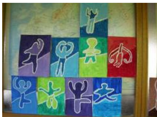
École Louis Pergaud - Coppélia