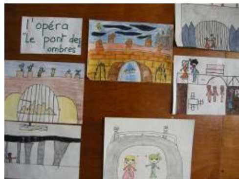
École Louis Pergaud - Le Pont des ombres