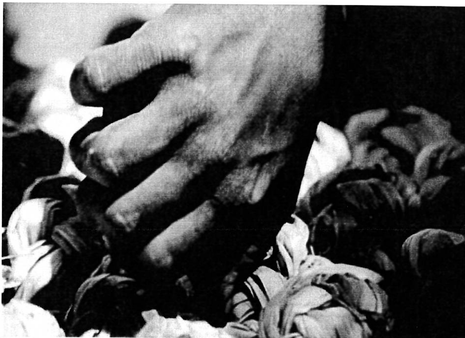
Lygia Pape, La main du peuple, 1975

Vernissage brunch le dimanche 19 février à 11h30.