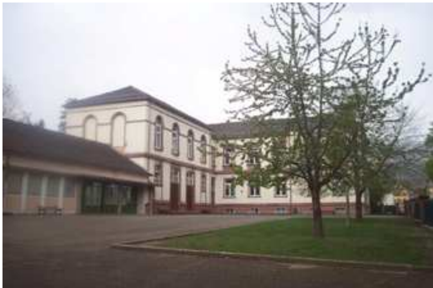
Vue d'ensemble côté jardin avec l'aile arrière "Patio" et le corps principal en retrait

A l'arrière (côté "jardin"), toujours sur l'axe transversal, des locaux d'enseignement se complètent d'une aile centrale conçue pour abriter, à chacun des deux niveaux, une grande salle.