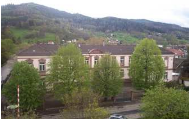
Vue d'ensemble côté "rue" depuis les bâtiments les plus récents

Il se compose d'un corps de bâtiment principal R+I avec sous sol et combles (total de surfaces de 1 815 m 2 ), avec une extension à l'ouest en RDC autour d'un patio central, ( total de surfaces de 735 m 2 ),