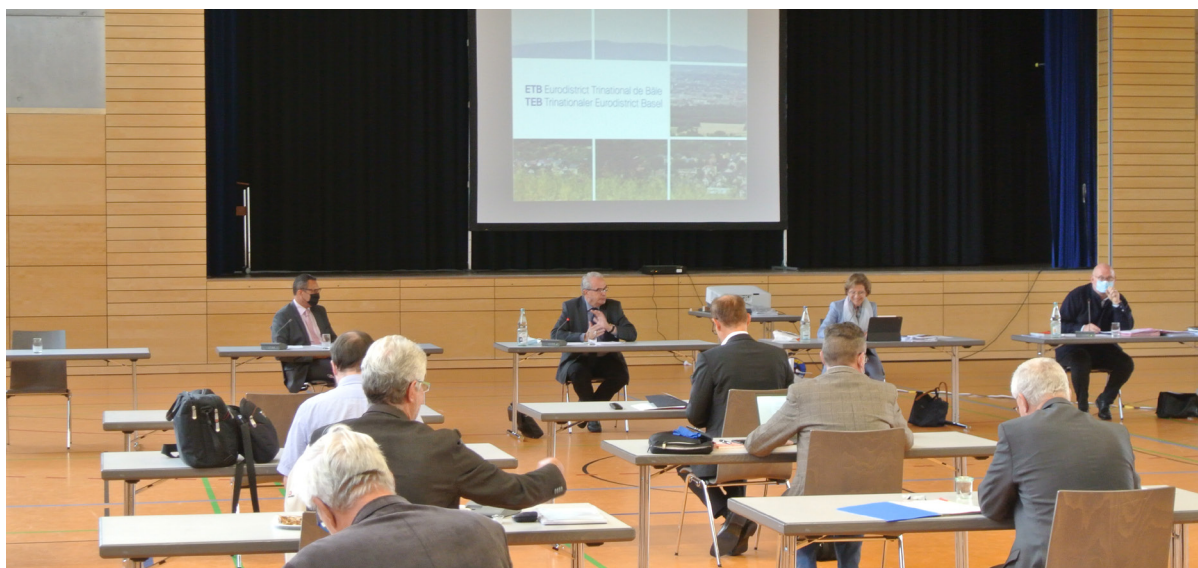
Assemblée générale de l'ETB en 2020, à Maulburg (D)

L'ETB encourage les contacts personnels et l'échange d'informations entre ses membres.