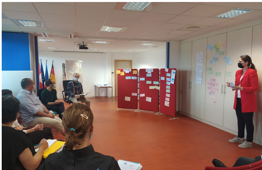
Echange entre experts de l'aménagement lors d'un workshop du 3Land, juin 2021

L'ETB assure d'une manière coordonnée et trinationale la représentation de la région et de ses intérêts au niveau régional, national et européen.