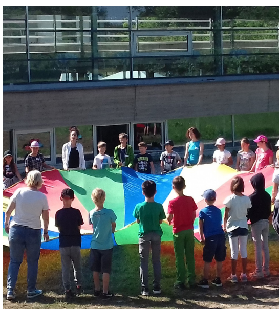
Projet du fonds de rencontre scolaire

L'ETB contribue au soutien du plurilinguisme au sein de la population, afin d'améliorer les conditions pour l'échange et les rencontres trinationaux. Il participe ainsi à faciliter l'accès au marché de l'emploi transfrontalier dans le pays voisin.