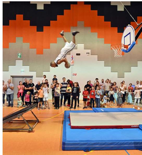
Projet Fonds de rencontre Festival Arts de rue, Saint-Louis