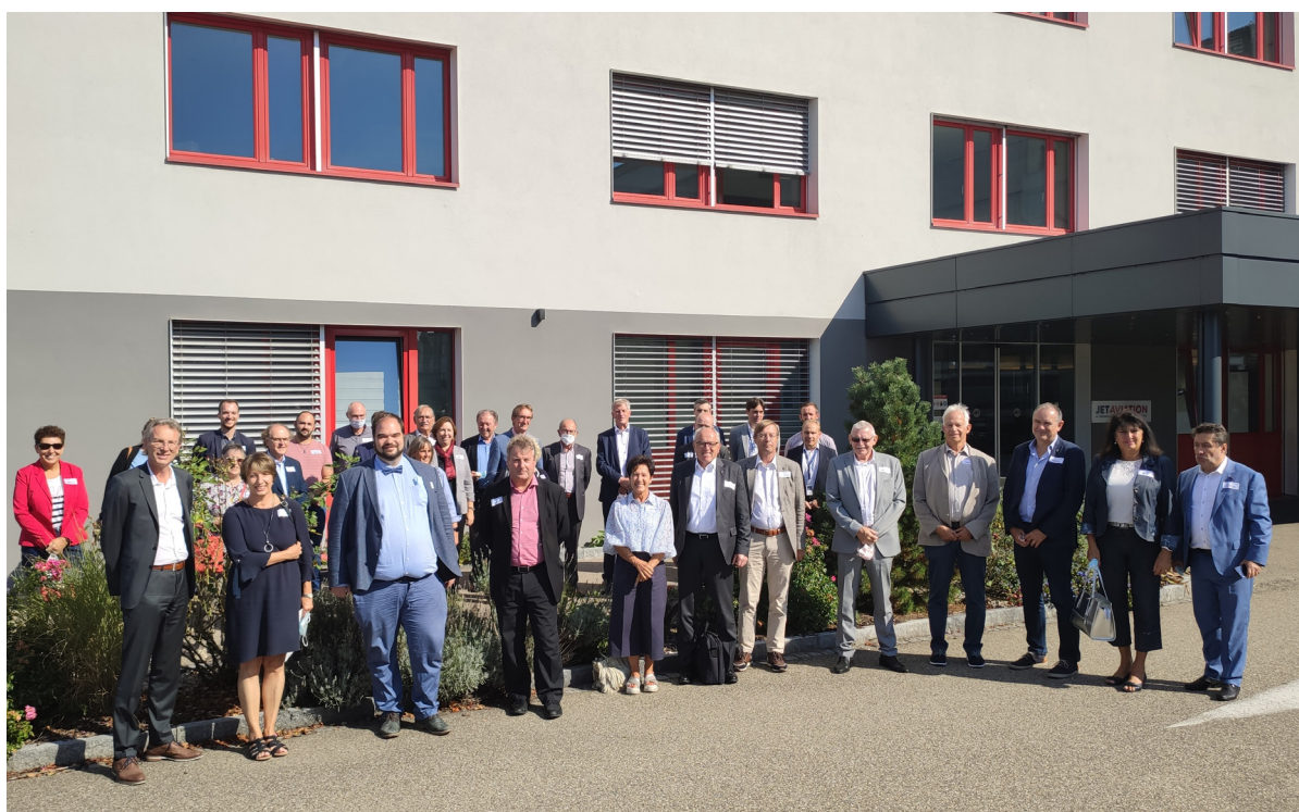
Journée des délégués 2021, avec les membres de l'ETB, Visite de Jet Aviation

Les membres sont régulièrement impliqués dans les activités de l'ETB et contribuent aux travaux politiques et aux projets de l'ETB.