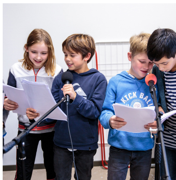
Microprojet Interreg Wanderhörspiel