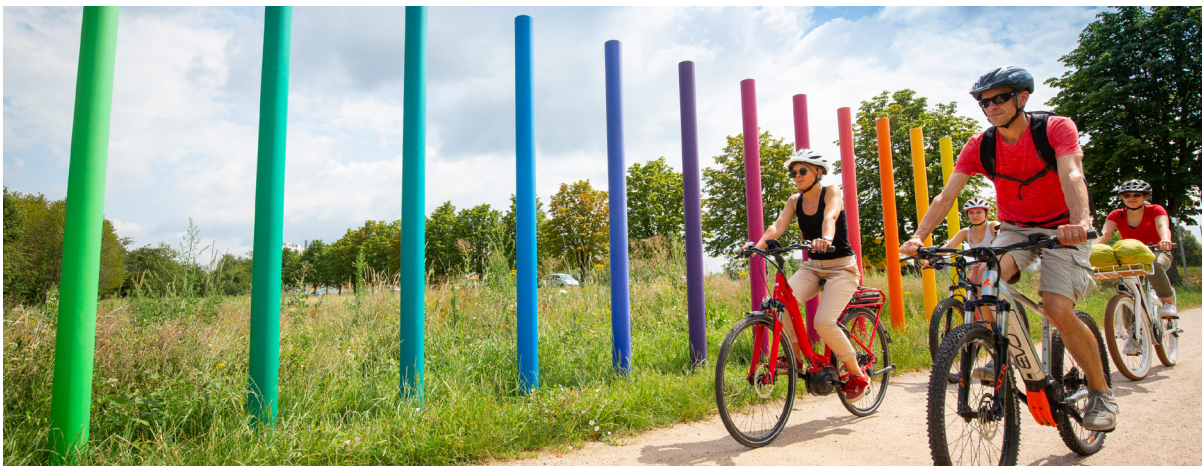
Cyclistes sur la grande boucle des trois pays (Projet Interreg V porté par l'ETB)

En principe, les projets sont portés par des membres de l'ETB. Lorsqu'aucun porteur de projet ne peut être trouvé, ces projets peuvent être confiés à l'ETB dès lors que cela correspond à un besoin trinational.