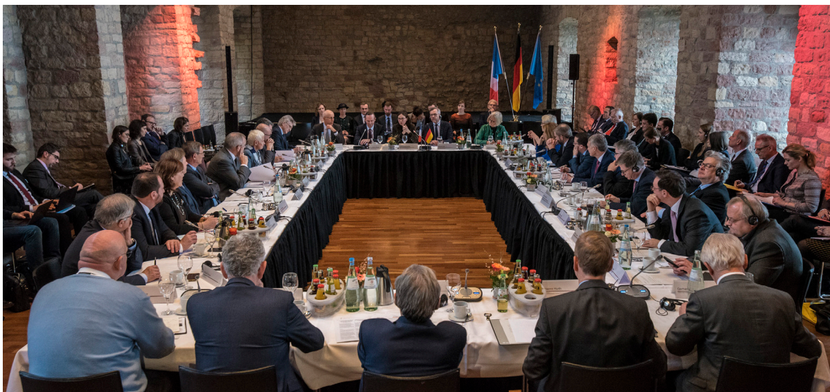
Réunion du comité franco-allemand pour la coopération transfrontalière en 2019, à Hambach (D)

L'ETB, grâce au dialogue entre les acteurs représentés au sein du Comité pour la coopération transfrontalière, concourt à l'identification et à la résolution des obstacles liés à la coopération transfrontalière.