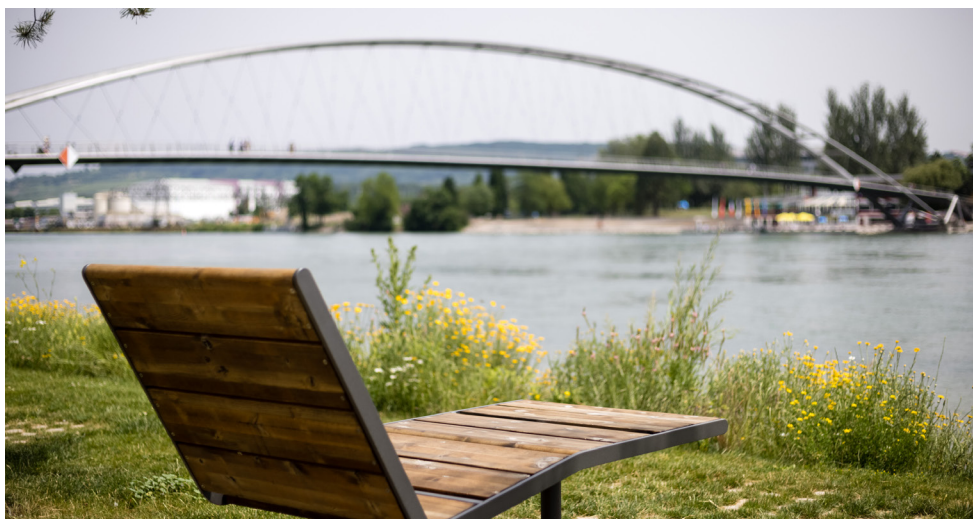
Parc Vis-à-vis à Huningue (Projet Interreg V porté par l'ETB)

L'ETB fournit à ses membres des informations sur le programme Interreg de l'UE et d'autres possibilités de financement, et sert de point de contact pour les idées de projets.