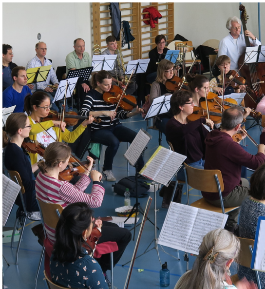
Projet Fonds de rencontre Répétition musicale transfrontalière, Trirhenum

La population de l'agglomération trinationale sera sollicitée pour des discussions autour de thèmes et projets transfrontaliers.