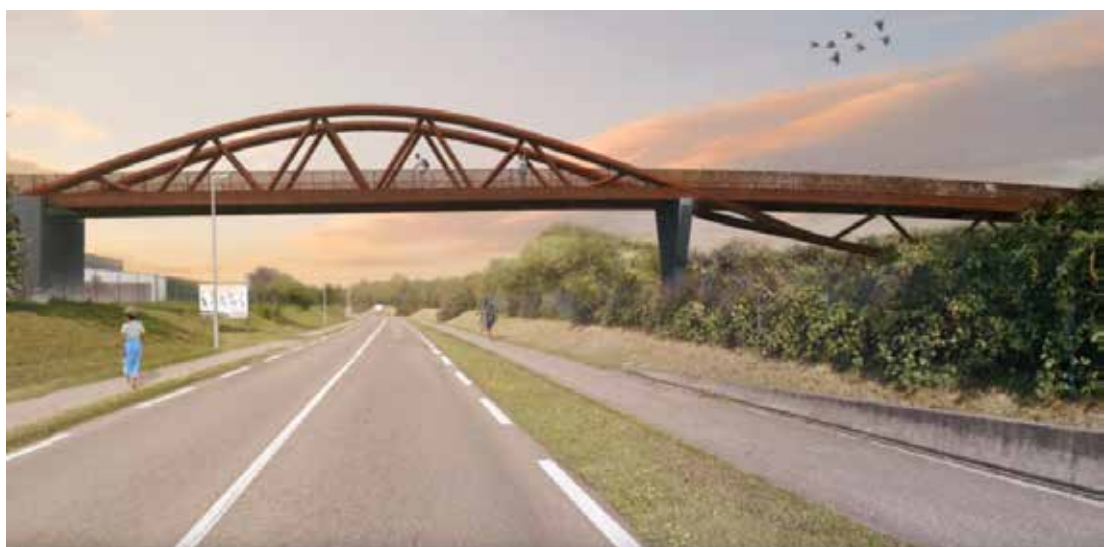
Visualisation de la passerelle