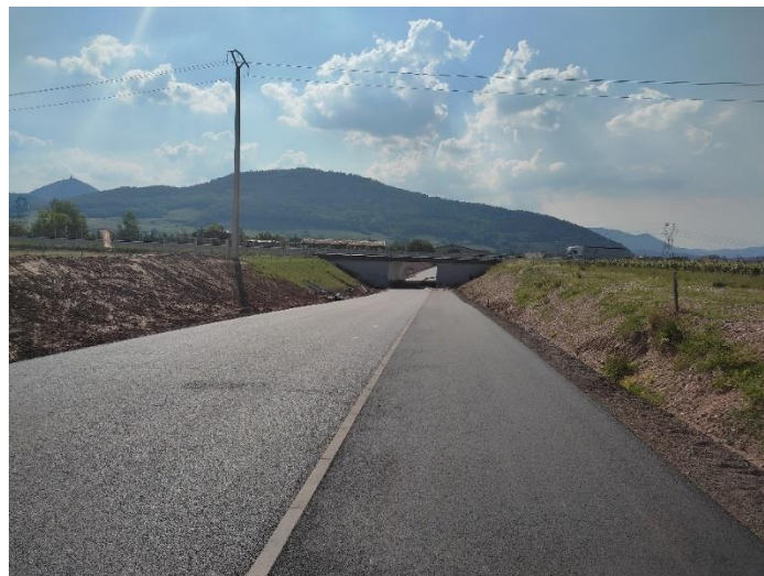
Vieux Chemin de Sélestat (phase 1).