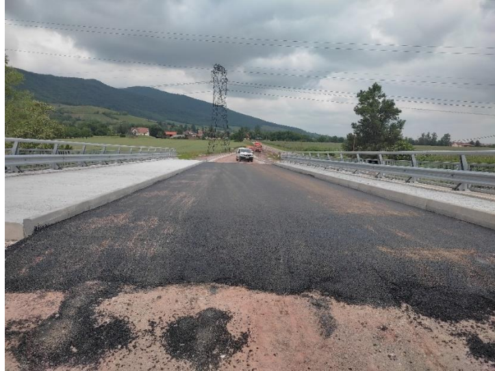
Travaux sur la RD35 (phase 2).