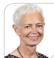
Brigitte Klinkert Canton de Colmar 2