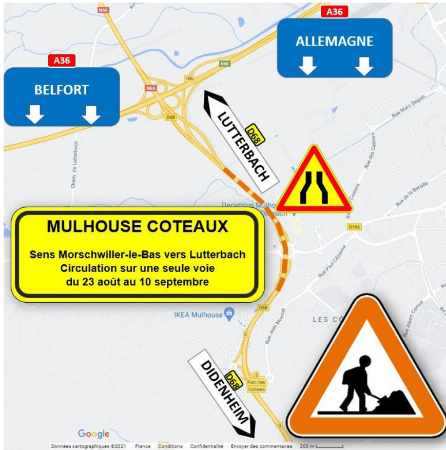
Travaux sur la 2x2voies RD68.