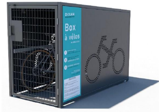
Box vélos sécurisés.

agrandie dans le courant de l'été 2022, avec l'implantation de 6 box vélos sécurisés et de deux arceaux motos.