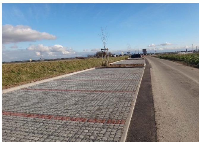
Des dalles drainantes favorisent l'infiltration des eaux de pluie et réduisent l'imperméabilisation des sols.

Des dalles drainantes seront posées afin de favoriser l'infiltration dans les sols et limiter au maximum l'imperméabilisation du site. Les voies de circulation resteront constituées d'enrobés. Les stationnements seront délimités par des pavés rouges sans aucun ajout de peinture.