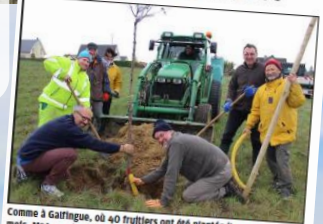
Comme à Galfingue, où 40 fruitiers ont été plantés il y a quelques mois, MZA soutiendra des plantations de hautes tiges.

Dans le cadre de sa politique de préservation de la biodiversité, MZA lance chaque année un appel à projets aux communes et associations, pour élaborer un programme d'actions annuel validé par un comité d'agrément.