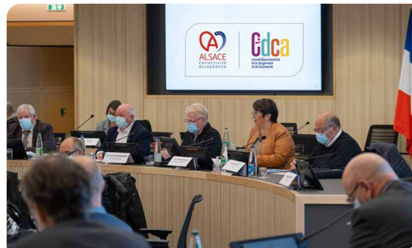
Installation du Conseil départemental de la citoyenneté et de l'autonomie Alsace – 9 novembre 2021 à Colmar