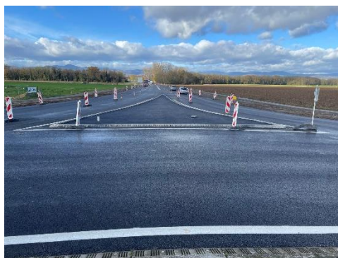
Giratoire Sundhoffen avec double voie d'entrée en venant de Colmar (au loin, double bordure en béton séparant les sens de circulation).