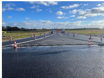
Giratoire Sundhoffen avec double voie de sortie en allant vers Andolsheim.