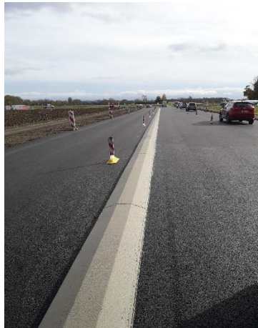
Coulage en place d'une double bordure en béton séparant les sens de circulation.

Ainsi, après la réalisation des travaux côté Andolsheim, le chantier se rapproche désormais de l'entrée de Colmar, avec la nouvelle configuration de l'échangeur autoroutier. Des enrobés en pleine largeur sur la RD 415 côté Est de l'échangeur et à l'extrémité de la bretelle de l'autoroute en venant de Mulhouse seront posés au cours des nuits du 20 et 21 décembre.