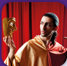
Schéma alsacien des enseignements artistiques