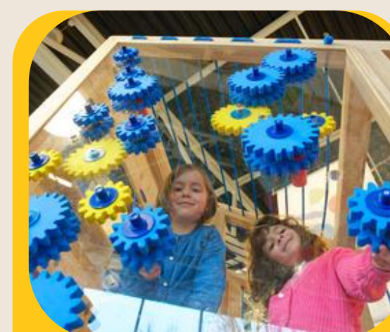
Culture scientifique : le Vaisseau