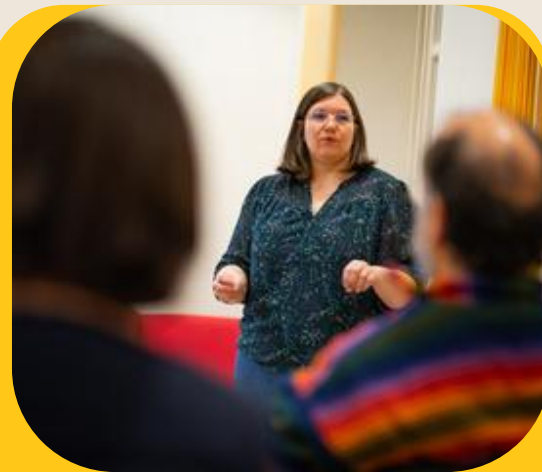
Mécénat de compétences