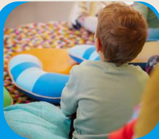
Création de places pour les enfants confiés