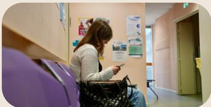
Regroupement des services sociaux de Colmar