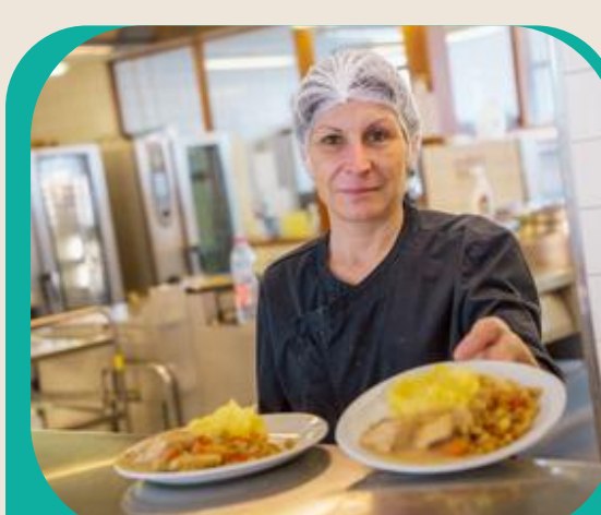
Tarification solidaire dans nos cantines