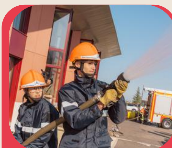
SIS : +4% de contribution