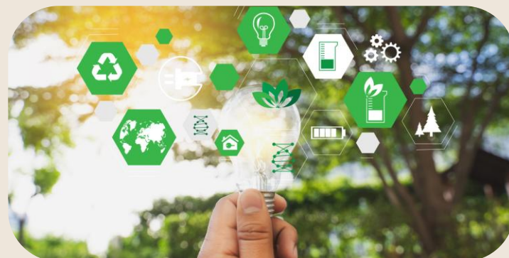
Développement de la SEM énergies