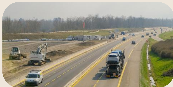
Aménagement routier 5A3F : 74,5M€