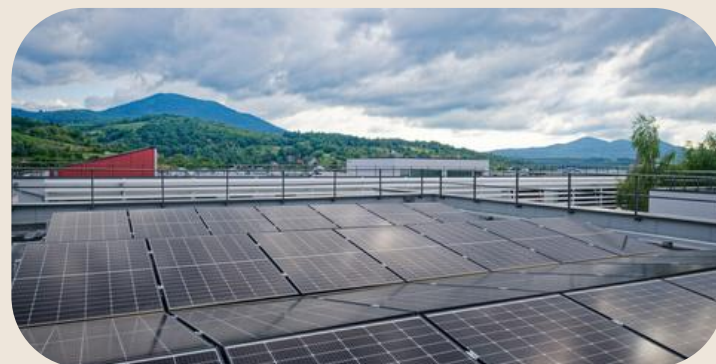
50 panneaux photovoltaïques