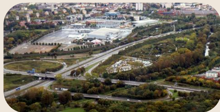
Echangeur de la Mertzau : 14 M€