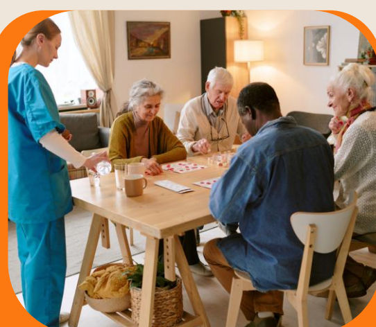
Bien manger dans les EHPAD