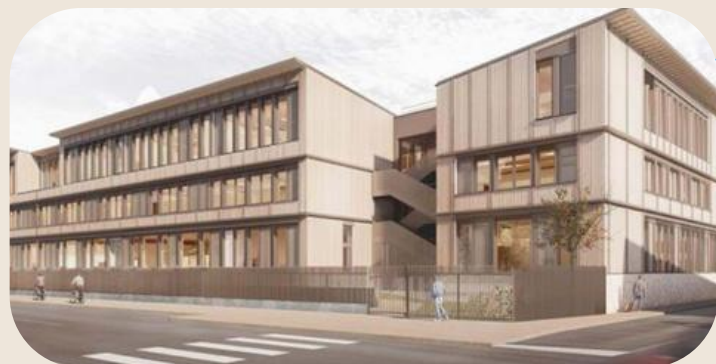
Construction du collège Lyauté : 29,8 M€