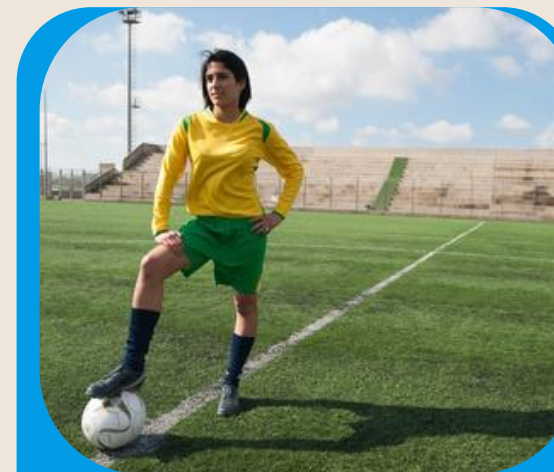
Coupe du Rhin Supérieur : tournoi trinationnel de football féminin