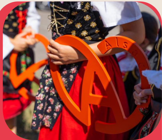
La marque Alsace