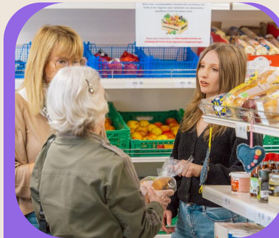
Soutien stabilisé aux associations