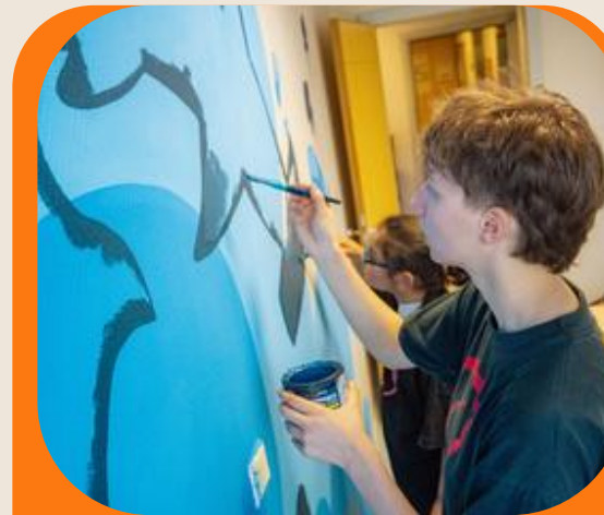
Accompagnement des 159 établissements d'enseignements artistiques