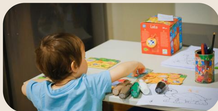
Restructuration du foyer de l'enfance Strasbourg : 30,7M€