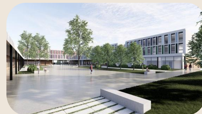
Reconstruction Collège Villon Mulhouse : 25,9 M€