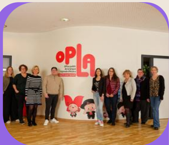
Création de l'OPLA