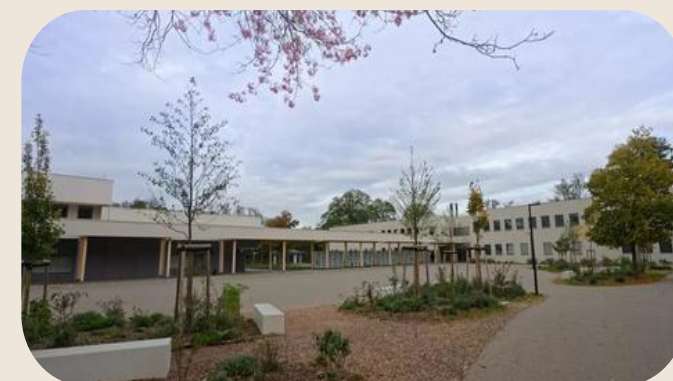
Restructuration Cité de Bischwiller : 14 M€