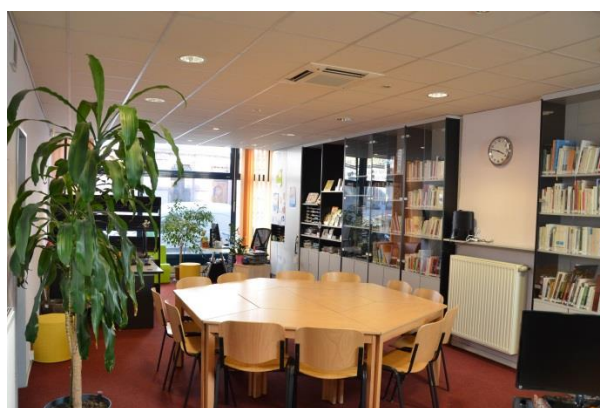
Centre de documentation