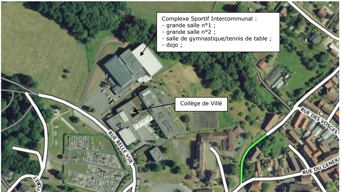
Villé : plan de situation Collège et Complexe Sportif Intercommunal