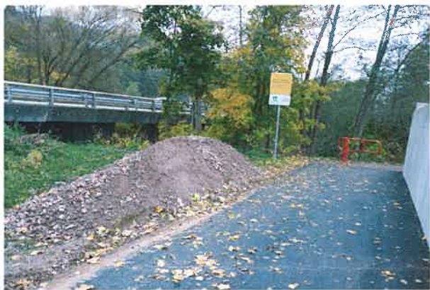
Vue jusqu'à la barrière et fin de l'enrobé