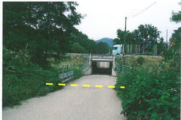
Vues en sens inverse (ci-dessus)

Fin de la piste à la limite du ban communal d'URMATT après le petit pont.