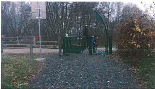
Dispositif sélectif et restrictif entre le parc et la rue des Loisirs