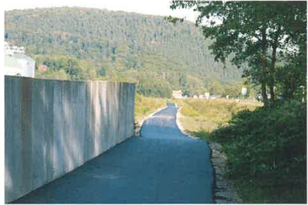
Vues en sens inverse (ci-dessus)