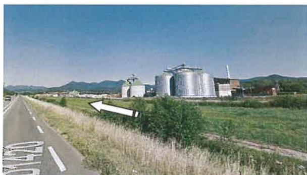
Vue en sens inverse