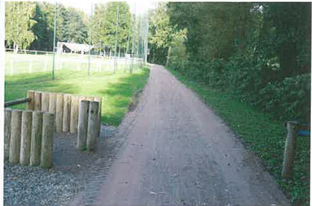
Vues en sens inverse (ci-dessus)