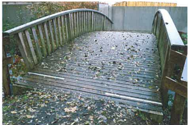
Vue en sens inverse