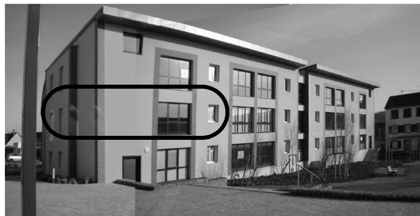
Photo 2: Vue depuis espace intérieur Façade Ouest