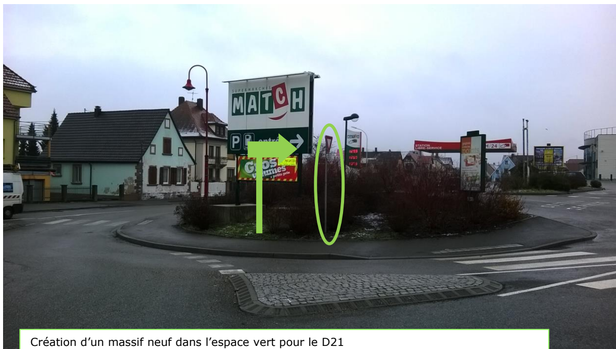
Création d'un massif neuf dans l'espace vert pour le D21 Dépose du panneau Ab3a et montage sur le nouveau D21 avec « Aire de covoiturage »

Localisation du panneau de signalisation directionnelle :